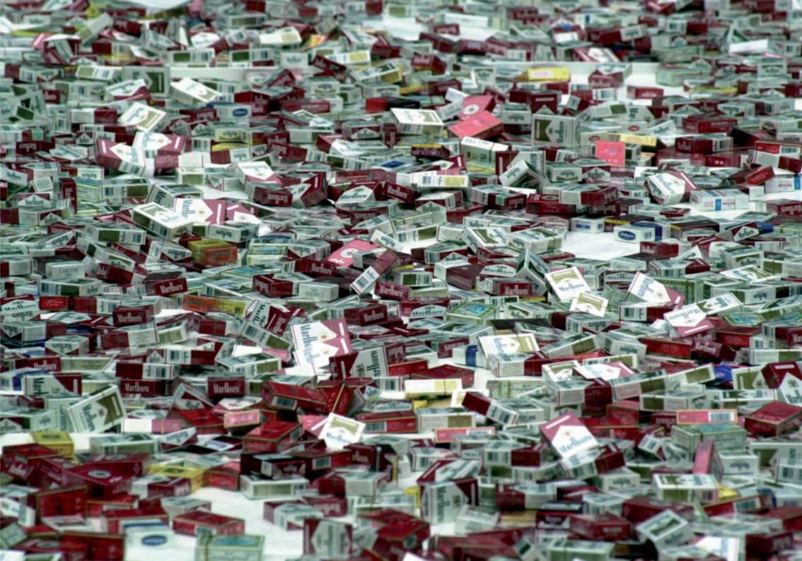
Destruction de cigarettes

Elle contribue donc, en s'opposant aux risques de fraude sur le commerce international, à la sécurité des citoyens, préserve l'environnement, défend les consommateurs et soutient l'économie légale.