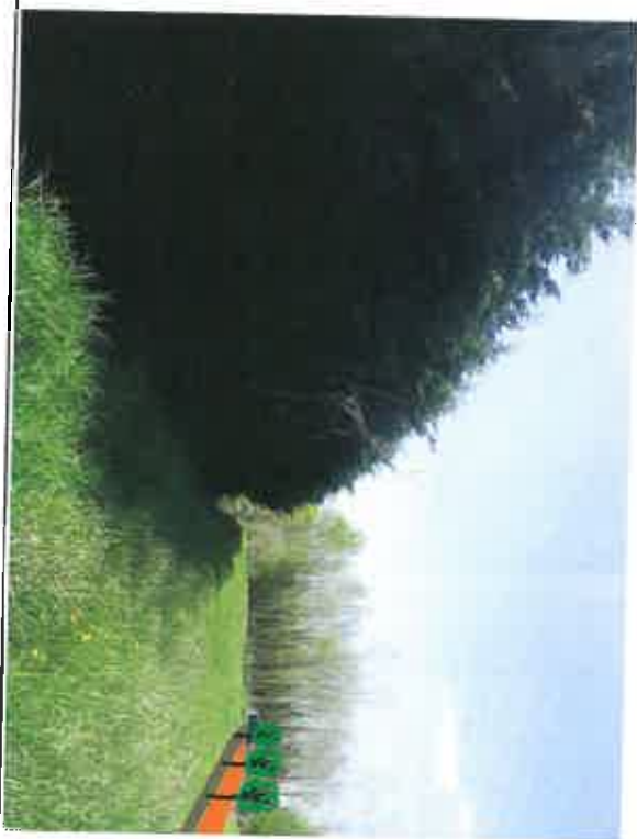
Emprise du chemin

Compatibilité avec les objectifs Natura 2000 Marais Poitevin : Travaux connexes hors du périmètre Natura 2000