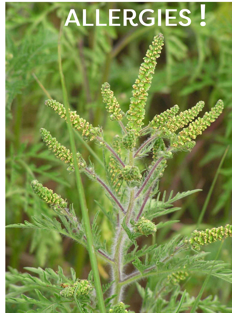
AMBROISIE À FEUILLES D'ARMOISE