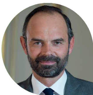
Édouard PHILIPPE Premier ministre